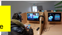
séries code sur poste individuel