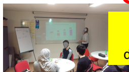
cours de code avec enseignant agréé