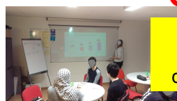
cours de code avec enseignant agréé