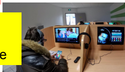
séries code sur poste individuel