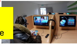
séries code sur poste individuel