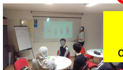
cours de code avec enseignant agréé